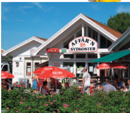
Nær øyas butikk og samlingsentrum.