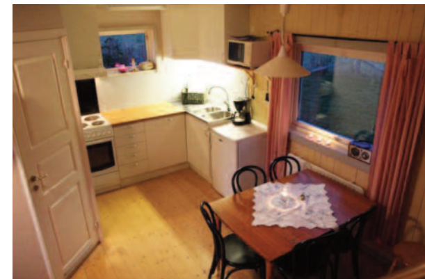
Kjøkkenkrok med komfyr, kjøleskap, kaffetrakter og microbølgeovn. Barnestol.