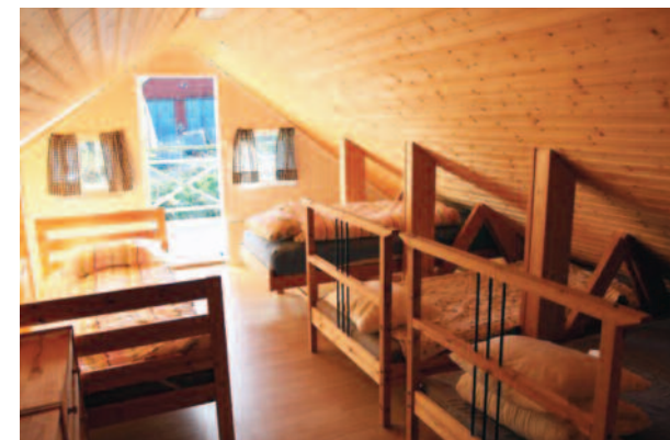
Soverom A i andre etage med dør ut til liten terrasse. Fire senger. Nye dyner og puter.