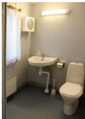
Bad med do, vask og dusj.