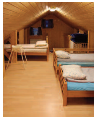
Soverom B med 3 senger, barneseng og en ekstrasing.