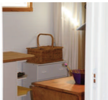
Picnickurven er klar til strandtur ...