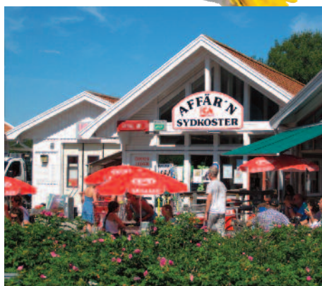
Nær øyas butikk og samlingsentrum.