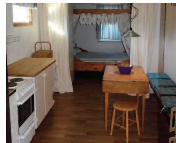
Fullt utstyrt kjøkken med liten frokostplass.

Summer house with two bedrooms, kitchen, living room with TV. Shower, and WC. Private garden with terrace. No smoking or animals inside. Countryside surroundings and close to lokal store. 400 meter to beach.