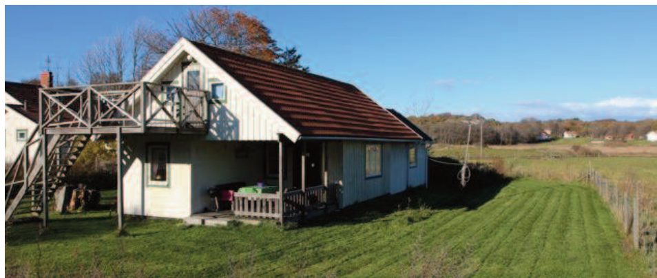
Lun overbygd terrasse med utemøbler. Grill. Stor gressplen/trädgård.