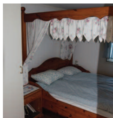
Sovealkove med dobbeltseng.